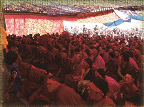
ཡེ་ཇི་ཉིད་ཀྱིས་གྲུ་ཚང་ལ་མཁའ་སྐོད་མའི་བྱིན་བསྐྱབས་གནང་བ།