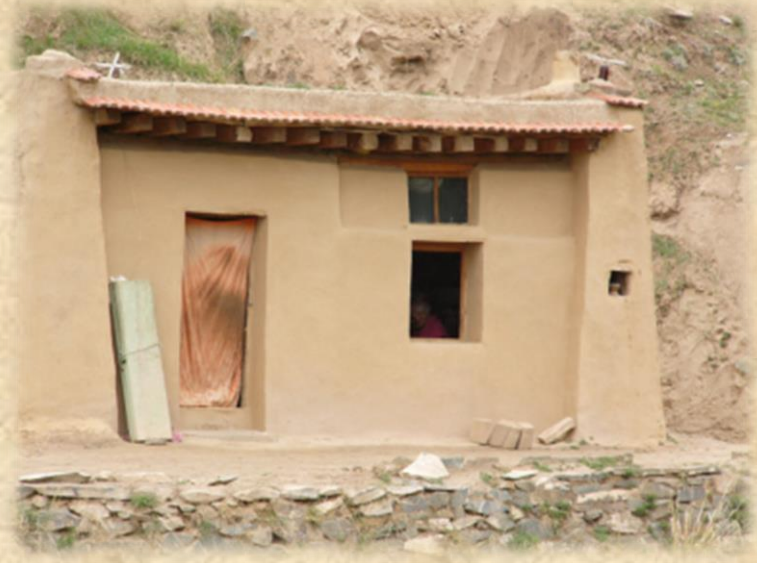
ཁོང་རིན་པོ་ཆེ་ཚང་གི་མཚམས་ཁང་།

སྤྱི་ལོ་༡༩༥༡རང་ལོ་རེ་གཉིས་སྟེང་། ས་འདིར་ཚོས་དཔེ་གཏན་ཏུ་བྱ་བ་སོང་བས་བཅའ་གུང་མི་ ཉེད། དཔེ་ཆ་མེད་ན་ཚོས་བསམ་བྱེད་པའི་སློབ་དཔོན་དང་། སློམ་སྐྱབ་བྱེད་པའི་ཤེས་རབ་ཀྱི་མིག་ དང་བལ་བ་ལྟ་བུ་ཡིན་སྟེ། ཉེ་བར་མཁོ་བའི་དཔེ་ཆ་འགའ་འཚོལ་སྟེར་སླ་བར་བཀའ་ཤིས་འབྲིལ་ དུ་སོང་། དེ་དུས་སླ་བར་ན་ཨ་ཁུ་བཞི་བཅུ་ཅམ་ཡོད། རྒྱ་གཉིས་ལ་བསྟན། ཨ་ལགས་འཇམ་པའི་ དབྱངས་ཚང་བཙོན་གྲོལ་བཏང་ནས་སྟེར་ཐེབས་པ་ལ་མཇུག། བསྟན་ན་མི་བ་དང་སློབ་དཔོན། དགོན་པའི་སླ་མ་ལས་སྟེ་ལའང་བཞག་དོགས་པ་དང་སྟོན་གྱི་གནས་ཚུལ་འདྲ་བ། གཞུང་དཔེ་ གཡར་བ་བཅས་མདོ་སྟགས་ཀྱི་གཞུང་པོད་སྐུམ་ཏུ་ལྷག་བསྐྱིགས་ནས་སྟེར་སློམ་མི་བུ་འབྱོར། དགུན་ཁར་བཅད་རྒྱ་དམ་པོས་མཚམས་ལ་སླ་གསུམ་ལ་བསྟན་བ་བཅས་བསྟོམས་ན་པ་ལུལ་སློམ་ མི་བུ་ལོ་བཅུ་གཉིས་འགྲངས་པ་ཡིན་ལོ།