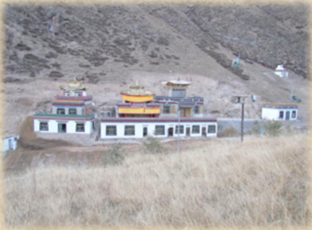
རྫོང་ཅེ་གསང་ཕུ་ཐུབ་བསྟན་དར་རྒྱས་སྡིང་།

དགུན་ཐོག་ཏ་དཔེ་འཚོགས། བརྗོད་དོན་ཉེས་ཅན་བཙོན་མ་འགའ་རེ་དཀར་འདོན་བྱེད་རྒྱུ་དེ་ རེད། སོང་ཉེ་ཉན་ན་དཀར་འདོན་བྱེད་རྒྱུ་དེ་བཙོན་མ་རེད་ཅག་རེད། ཅིའི་སྲིད་ཉེས་ཅན་མི་ནག་ཏུ་ གྱུར་བ་དང་ད་ཉེས་པ་དག་སྟེ་དཀར་འདོན་དགོས་པའི་རྒྱ་མཚན་སྲུང་གུང་མི་ཤེས། སྲིད་སླ་བར་ དུ་སོང་། དགོན་ནང་དུ་འགྲོ་བའི་འཇུག་ཉོས་ཀྱི་ཉེ་གང་འདེམ་བྱས་ཚོགས་གྲང་མ་འདེམ། སྲེ་ཡིག་ རེ་བྱིན། ཉོས་རན་ཉོས་ཉོ་བྱས། དོན་དུ་མི་ནག་ཁྲིམ་ནག་ཅེས་པའི་མིང་སྲུང་ནས་གར་འདོད་དུ་ ཉུལ་ནས་བསྟན། ང་འབྲ་བ་མང་བོ་རེད། འགྲུལ་སྐྱོད་ཐོན་ན་བློས། དེ་དུས་ལྷག་པར་ཚོས་ལ་རེས་ ཤེས་དང་དད་པ་ཤུགས་བྲག་ཏུ་སོང་ནས་ཁ་དོན་དགེ་སྦྱོར་དང་ཉམས་ལེན་སྒོམ་སྦྱབ་གཤམ་མ་ ཞིག་བྱེད་འདོད་སྦྱེས། སླ་བར་རི་ཁོང་གོང་མ། རྒྱུ་རྒྱ་རི་ཁོང་། བསང་ཁོག་ལྷུང་ཅེའི་རི། ཅན་ རྒྱུའི་བྲག་དཀར། ཅ་ཡུས་སྒོས་སུ་ལྷོད། འཕོ་རའི་མཁར་ལུང་སོགས་སུ་ང་དགུ་དང་དུག་ཅུ་ཐམ་ པའི་ལོ་སྟེ་སུ་གོ་དང་དཀར་ཁག་ཏ་ཅང་ཆེ་དུས་ལམ་སྲགས་གཉིས་སྲས་མགོ་ལ་བཞག་ཉེ་འཆི་ངོ་ མ་བྱས་ནས་མཚམས་ལ་བསྟན།