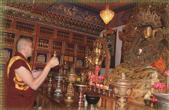
ཡེ་ཤོང་ཚང་གིས་འབའ་ཡུལ་ཇི་ལོའི་མདུན་དུ སྐྱབས་འཇུག་ལུ་བཞིན་པ།