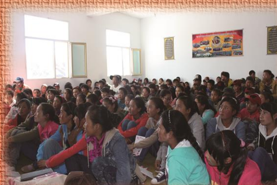
འབའ་ཡུལ་འོ་ཏུ་འདི་རིག་གནས་ཐབས་སྐོར་གི་བྱང་འགྲུབ།