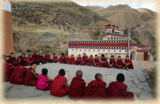
འཇང་ཆེན་ཚད་མ་རིག་པའི་སྟོབ་སྒྲིང་།

བ་ལ་སྟེགས་བྱ་བྱས་ནས་དམིགས་རིམ་རྩལ་ཅམ་བསྐྱེད་ས་ཁུལ་གྱིས་ཅི་ཡིན་ཆ་མ་འཚེ། བདེ་ ལྷོང་ངང་འབྲམས་བ་ལྟ་བུའི་ངང་སད་པའི་ཚེ། ལུས་སྦྱང་ལ་ཉིན་གཉིས་པའི་ཉི་འོད་འཕོག་སྟེ་རྩོད་ འཛོམ་འདུག དེ་ནས་བཟུང་བྱིན་བརྒྱབས་ཅན་གྱི་སྣ་ཡི་དམ་འཁོར་ལོ་བདེ་མཚོག་ཡབ་ཡུམ་གྱི་ སྐོམ་སྐྱབ་གཙོ་བོར་མཛད་ལ། འགལ་རྒྱུན་སྐྱིབ་བ་སྦྱོར་བྱིར་དོར་སེམས་བསྐོམ་བརྒྱས་དང་། མ་ཐུན་རྒྱུན་ཚོགས་བསགས་བྱིར་ཡན་ལག་བདུན་པའི་སྐོ་ནས་མཚོད་བ་དང་མཐུལ་གྱི་གྲངས་ བསོག་ དཔལ་རི་བོ་དགེ་ལུན་པའི་སྟན་བརྒྱུད་གདམས་བ་ཟབ་མོ་སྐྱ་མའི་རྣལ་འབྱོར་ནི་ལམ་གྱི་ སྟོག་ཤིང་ཡིན་ན། ངས་ཀྱང་དེ་ལ་འདུས་ནས་བྱང་འདུག་ཟབ་མོའི་ཉི་ལམ་བསྐོམ་བ་ཡིན་ གསུངས་བ་ཅམ་ལས་ཇི་ལྟར་སྐྱབ་པའི་ཚུལ་དང་ཞལ་གཟེགས་ཉམས་ཉོགས་གྱི་རིམ་བ་རྣམས་ སྐབས་འདིར་བྱར་ཅམ་ཡང་མ་གསུངས་མོད། འོན་ཀྱང་། བདག་གིས་རང་ལོ་བཅུ་དྲུག་སྟེང་ནས་ བཟུང་ད་ལྟའི་བར་བསམ་སྦྱོར་གཉིས་གྱིས་ཚུལ་བཞིན་དུ་བསྟེན་པའི་གོ་སྐབས་བཟང་བོའི་འོག་ མཐོང་ཐོས་དོགས་གསུམ་དུ་བཅུག་བ་རྣམས་རྩལ་ཅམ་འབྲི་སྟོན་གྱིས་སྟོབས་བ་ཆེར་བསྐྱེད་ནས་ བཞད་པར་བྱའོ། །