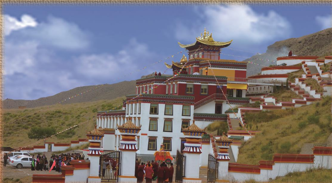
ཡེ་ཤོང་ཚང་གིས་གསར་བཞེངས་བྱས་པའི་འདི་རིག་གནས་བྱང་ཚུབ་གླིང་།